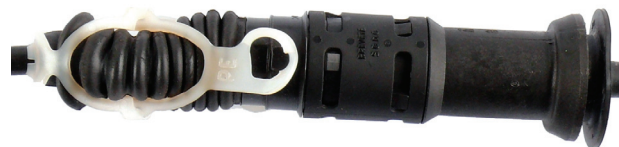
Рис. 2: Фиксация с помощью белого пластикового хомута