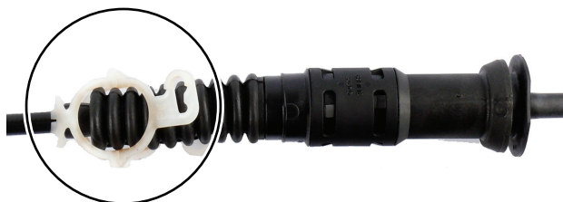
Рис. 5: Фиксатор ослаблен (белого пластикового хомута)