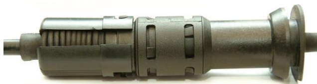
Рис. 1: Фиксация с помощью байонетного патрона

Для данной модификации троса привода приспособление автоматической регулировки фиксируется либо с помощью байонетного патрона (Рис. 1), либо пластикового хомута (Рис. 1).